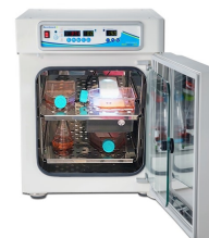
Cell images taken with IncuView