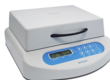
Heat up time PST-60HL and PST-60HL-4