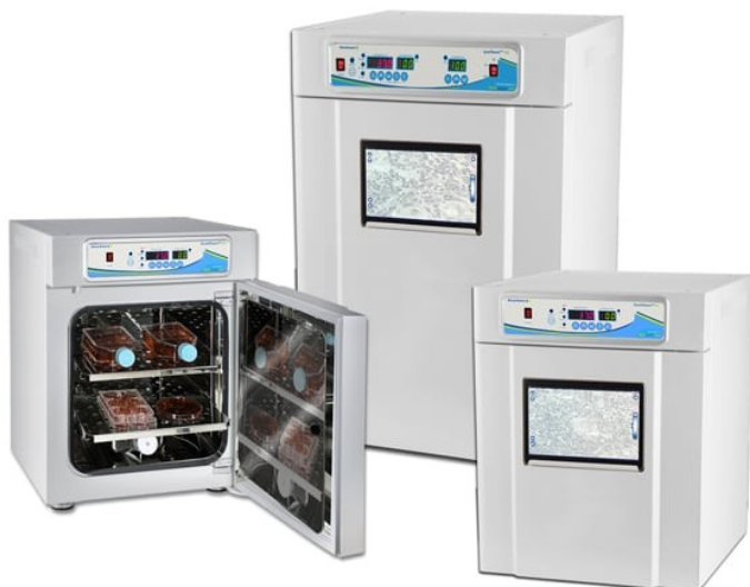
Cell images taken with IncuView