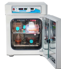
Cell images taken with IncuView