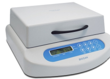
Heat up time PST-60HL and PST-60HL-4